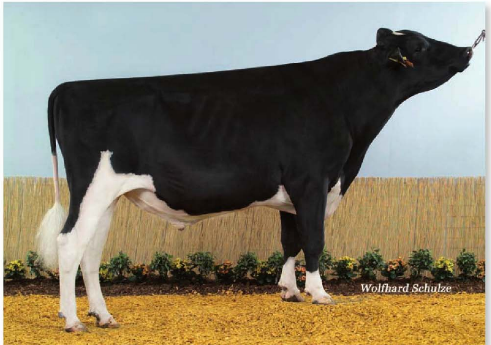
Guarini (Goldwyn x O-Man) ha escalado para estar entre los 5-mejores de Alemania y también tiene buenas cifras en varios otros países del mundo.